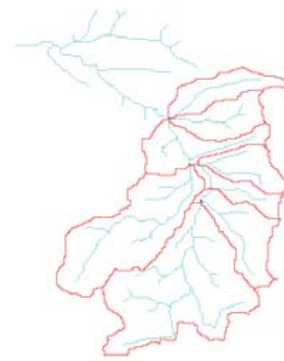
Abbildung 1: blau - Kupfer mit Nebenflüsse, rot - TEG bis Kupferzell

Sporadisch (etwa 1-2 mal im Jahr) kommt es zur Überschwemmung des Marktplatzes in Kupferzell. Durch den Ort fließt die Kupfer. Unweit des Marktplatzes münden der Lietenbach (LB) und der Feßbach (FB) in die Kupfer. Zu klären war nun, ob und inwieweit die beiden Bäche mit ihrem Abflussverhalten verantwortlich für die Überschwemmung sind.